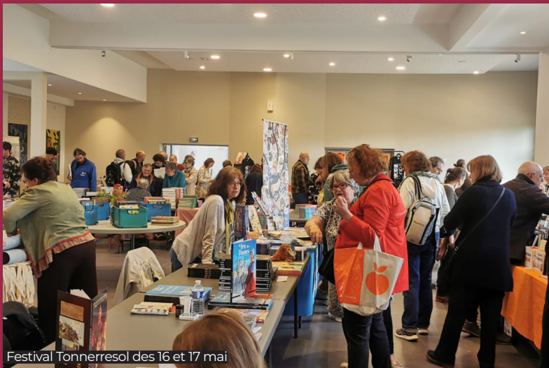
Festival Tonnerresol des 16 et 17 mai