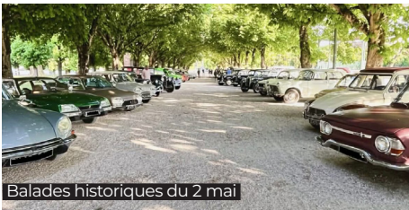
Balades historiques du 2 mai