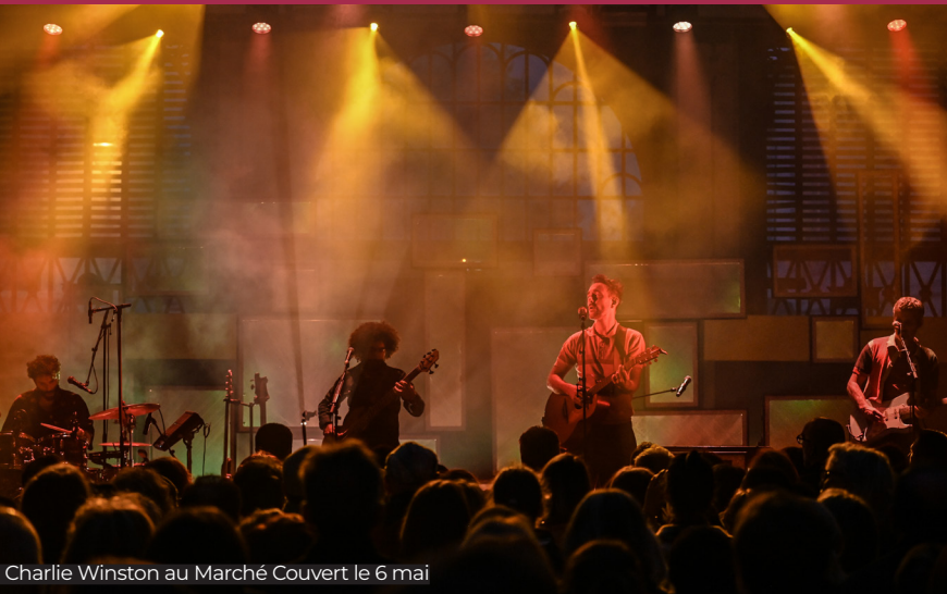
Charlie Winston au Marché Couvert le 6 mai