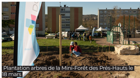
Plantation arbres de la Mini-Forêt des Prés-Hauts le 18 mars