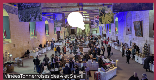
VinéesTonnerroises des 4 et 5 avril