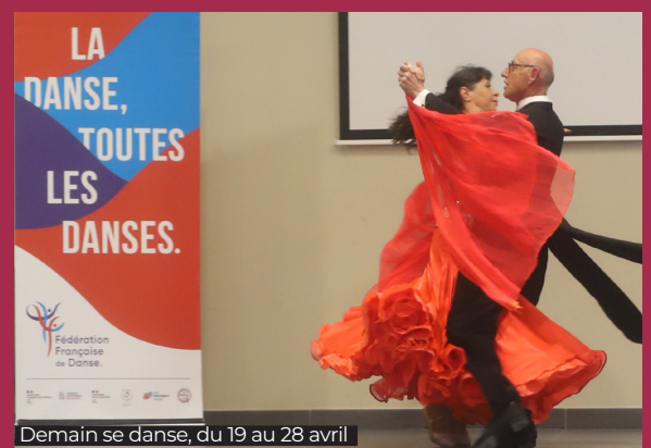
Demain se danse, du 19 au 28 avril