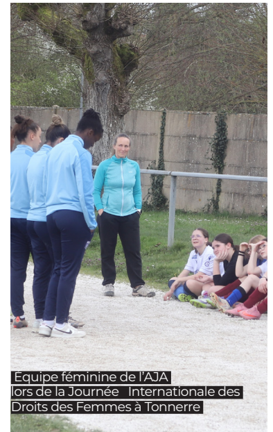
Equipe féminine de l'AJA lors de la Journée Internationale des Droits des Femmes à Tonnerre