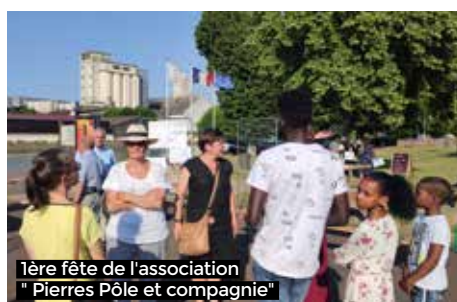
1ère fête de l'association " Pierres Pôle et compagnie"