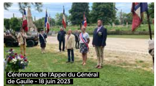
Cérémonie de l'Appel du Général de Gaulle - 18 juin 2023