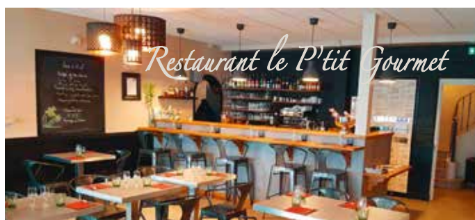
Restaurant le P'tit Gourmet - Hôtel du centre 63 rue de l'Hôpital 89700 TONNERRE - 03 86 55 10 56 contact@hotel-tonnerre.com