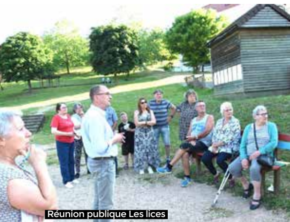
Réunion publique Les lices