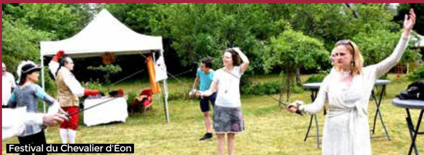
Festival du Chevalier d'Eon