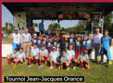
Tournoi Jean-Jacques Orance