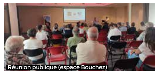
Réunion publique (espace Bouchez)