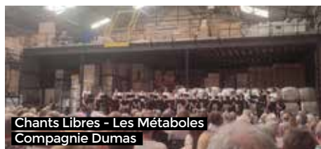
Chants Libres - Les Métaboles Compagnie Dumas