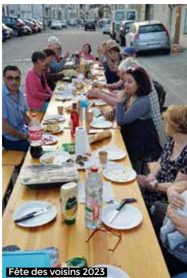
Fête des voisins 2023