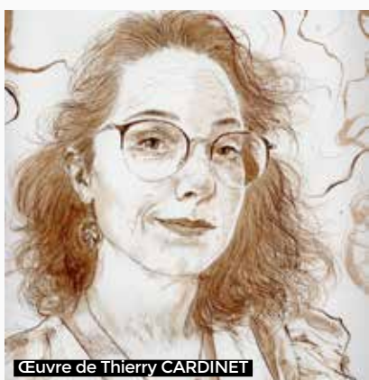
Œuvre de Thierry CARDINET