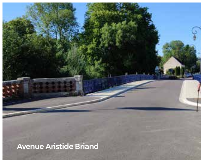
Avenue Aristide Briand

En 2021 la liaison canal de Bourgogne - centre-ville a débuté par la mise aux normes PMR (personnes à mobilité réduite) en complément de la rénovation du pont dit « des services techniques ». Les travaux du pont ont été réalisés par le Conseil Départemental, tandis que ceux de mise aux normes des trottoirs l'ont été par la Ville de Tonnerre, pour un budget de 70.000 €. La chaussée du chemin de Chienecotte, le parvi de la Poste et la rue du château à Vaulichères ont été réalisés. Il est à noter qu'il n'y a aucune subvention possible pour les travaux de voirie hors aménagements sécuritaires.