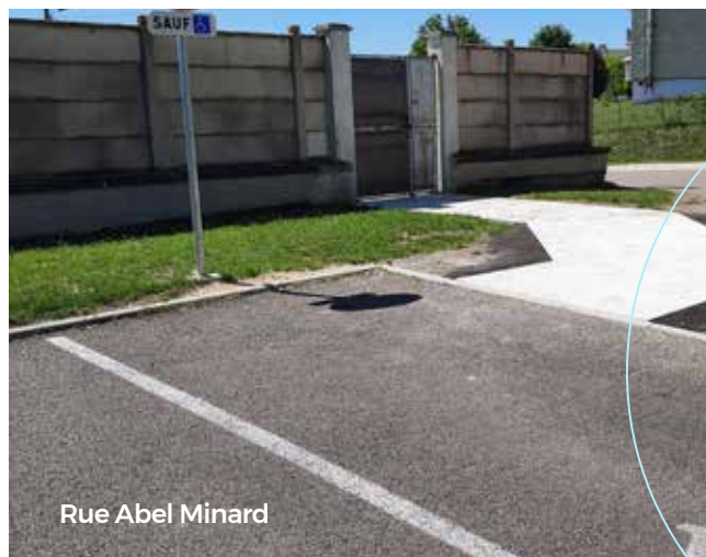
Rue Abel Minard