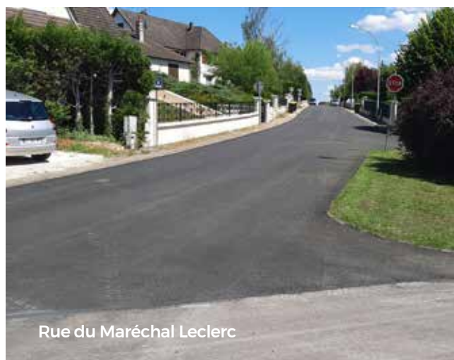
Rue du Maréchal Leclerc